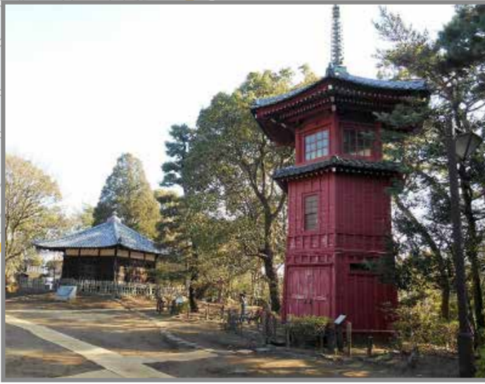
新井薬師 梅照院 Araiyukushi Baishoin Temple

哲学堂公園 Tetsugakudo Park 哲学堂公園は明治37年に哲学者で東洋大学の創立者井上円了博士によって精神修行の場として創設されました。哲学世界を視覚的に表現した、全国に例を見ない公園で、2020年国名勝公園に指定されました。