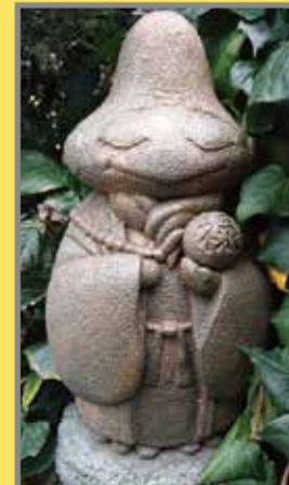
⑦福祿寿 Fukurokuju (地図上:B-2)