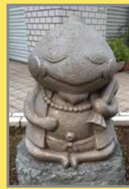
⑥布袋尊 Hoteison (地図上:C-2)