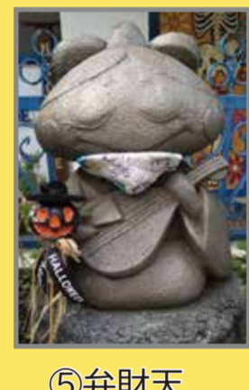
⑤弁財天 Benzaiten (地図上:C-2)