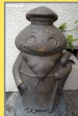
②寿老人 Jyurojin (地図上:C-3)