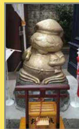
④恵比寿 Ebisu (地図上:C-2)