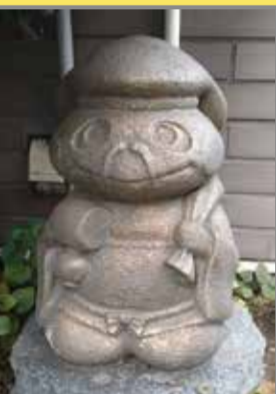
③大黒天 Daikokuten (地図上:C-3)