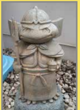
①毘沙門天 Bishamonten (地図上:C-3)