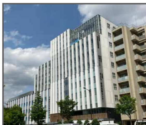
⑨ みらいステップなかの(地図上:E-2)

約600年前に中野長者と呼ばれた鈴木九郎が、夭折した娘を弔うために娘の法名を取り正観寺としたのが成願寺の始まりである。九郎と娘の遺骨は境内に祀られている。