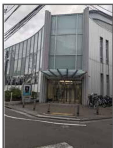
⑦ 写大ギャラリー(地図上:D-4)