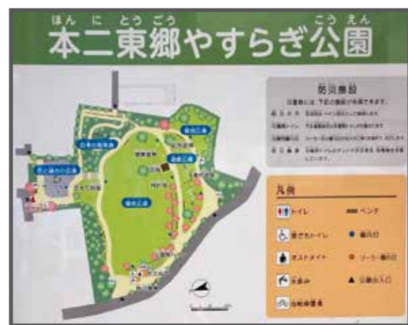
⑥ 本二東郷やすらぎ公園(地図上:D-4)