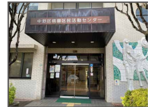
① 桃園区民活動センター(地図上:A-1)