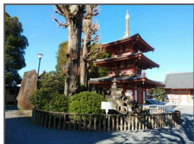
⑤ 宝仙寺三重塔・石白塚・中野町役場跡碑(地図上:D-2)