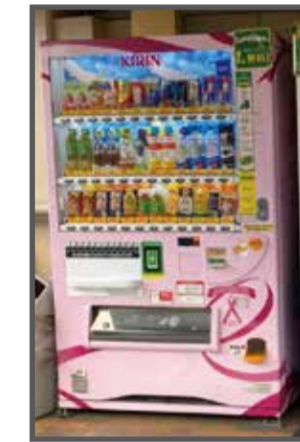
② 新渡戸記念中野総合病院(地図上:A-1)