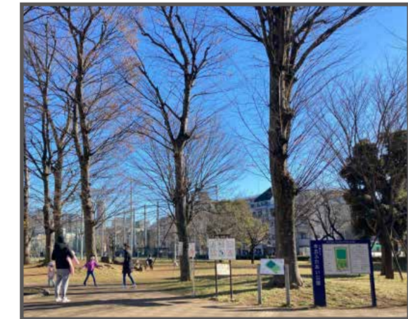
④ 本五ふれあい公園(地図上:A-5) 多目的運動場と草地広場があり、防災施設も備えている。

明治時代の実業家の杉山氏が娘の病氣療養のために移りすんだが、娘は亡くなり、大正14年に中野区に邸宅と土地を寄付した。公園の一角に親子三体の杉山地蔵尊がある。